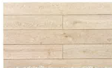
オーク柄/ホワイト PHFL1036