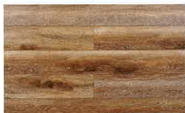
オーク柄/ダークブラウン PHFL1035