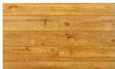
オーク柄/ライトブラウン PHFL1034